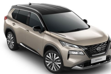
Imagine cu titlu de prezentare: ePOWER Tekna Plus